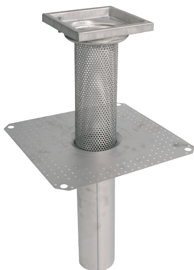
Terrassil 401 Art.nr. 50401170110