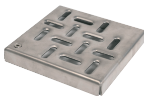
Silgaller Terrassil 401 Art.nr. 5079016800103S