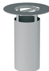
Sandfång 401 Art.nr. 50780002005

Terrass 401 består av en underdel (brunn) tillverkad i rostfritt syrafast stål (EN 14401) och en överdel (terrassil) som sticks in i brunnen. Överbyggnadens höjd är max 330 mm. Brunnen förses med låsbart silgaller med belastningsklass L15.