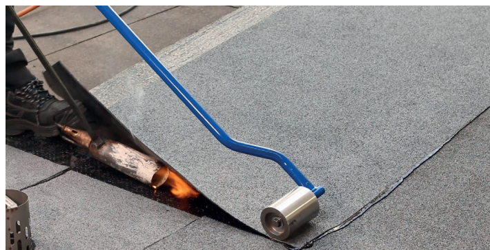
2. Svetsa tätskiktet mot rännalsvådens frilagda kant.