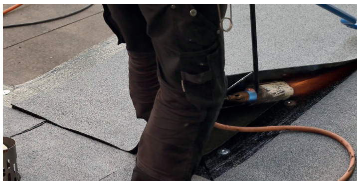
1. Svetsa våderna ända ner till rännalsvåden.

För ytterligare information om montering, kontakta vår taktekniker.