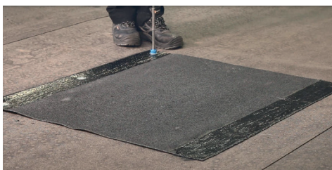
5. Fäst in rännalsvåden mekaniskt.