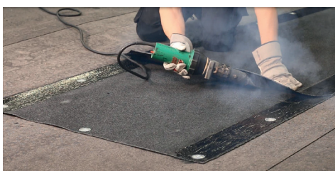
8. Helsvetsa rännalsvådens överlapp. Börja längst in och se till att kapsla in värmen för att uppnå bästa resultat.