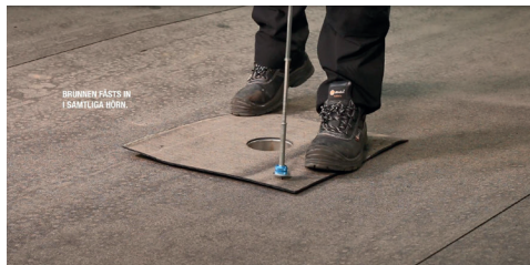
1. Fäst in takbrunnen i alla fyra hörnen.

För ytterligare information om montering, kontakta vår taktekniker.