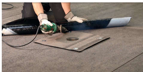
4. Rulla ut och helsvetsa rännalsvåden. Dra samtidigt av releasefilmen.