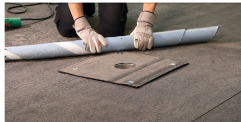
3. Rulla upp rännalsvåden för att komma åt att svetsa.