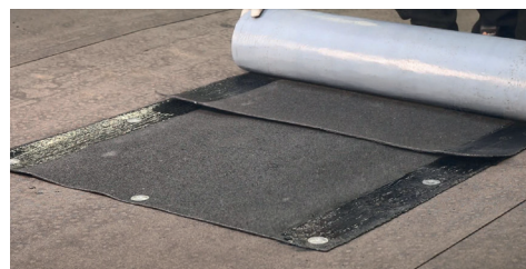
6. Anslut med E-Lit RV. Ta bort releasefilmen i överlappet. Övrig releasefilm kan tas bort vid behov.