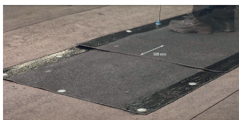
7. Skarvar i rännaldalar ska helsvetsas minst 300 mm. Alternativt förstärks skarvarna med en underliggande remsa av minst kvalitet YEP 3500, B=0,33 m och L=1 m. Den underliggande remsan ska helsvetsas mot de överliggande våderna. Rännalsvåd i anslutning till vertikal ska utformas så att rännalscentrum bildas minst 500 mm från den vertikala ytan.